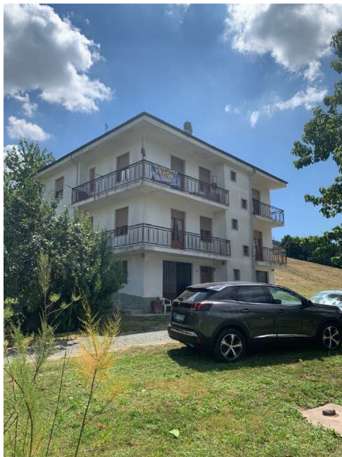
Esterno del Gruppo Appartamento

Tel. 3888538220 - 3917230879 e-mail: lacoccinella@21coop.it