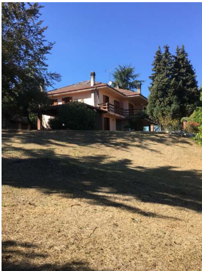
Esterno del Gruppo Appartamento

Tel. 3888538220 - 3917230879 e-mail: lacoccinella@21coop.it